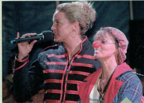
Beim Sommerfest für Bewohner und Gäste waren unter anderem zwei Vorstellungen vom Circus Ascona zu erleben.

Im Wohnpark Zippendorf wurde kürzlich an zwei Tagen hintereinander gefeiert: ein großes Sommerfest am 1. Juli und tags zuvor der zehnte Geburtstag von Haus 3. Beides fand in einem Zelt vom Circus Ascona statt.