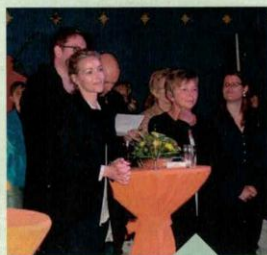
Viele Gäste kamen zum Empfang am 30. Juni.