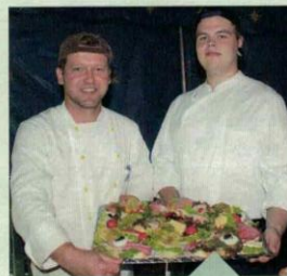
Wohnpark-Köche sorgten für das Büfett beim Empfang.