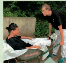
Schubkarrenlauf bei der Mitarbeiter-Olympiade